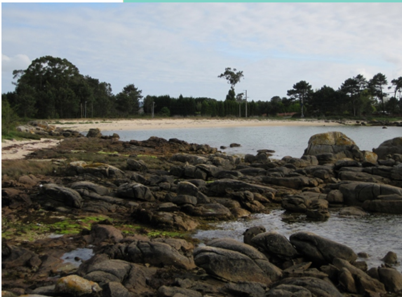
Praia de Espiñeiro desde O Mallón