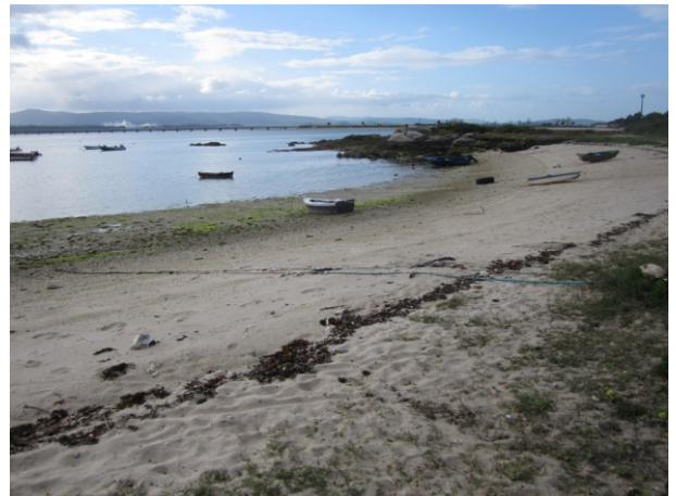
Vista desde a Punta Sapeira cara á Ponte

Partindo do Vao, e seguindo o sendeiro paralelo á nova estrada que vai ao Xufre, achegámonos por Riasón e a Punta Sapeira a Cabodeiro e, desde aí, pasando pola Punta dos Furados, ao Xufre; do Xufre imos ao Cantiño e do Cantiño, polo paseo, imos á Salga e por Pedracerrada e a Praia Abilleira á Punta do Sal e á Punta Ouriceira, e pola praia do Mallón a Espiñeiro, desde onde cruzamos a Camaxe e volvemos ao Vao.