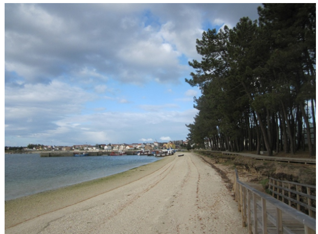
Paseo de Cabodeiro