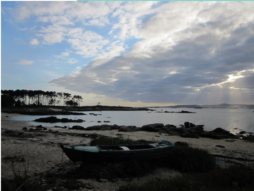
Praia de Gradín e Punta Ouriceira á tardiña