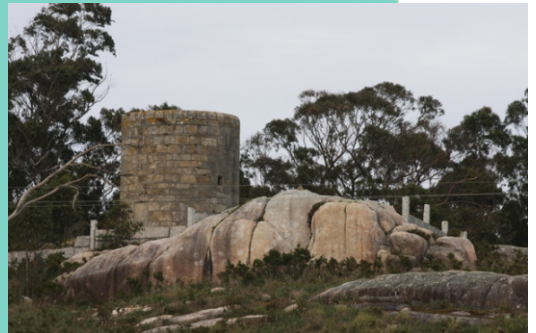
Torre do Muíño de Vento