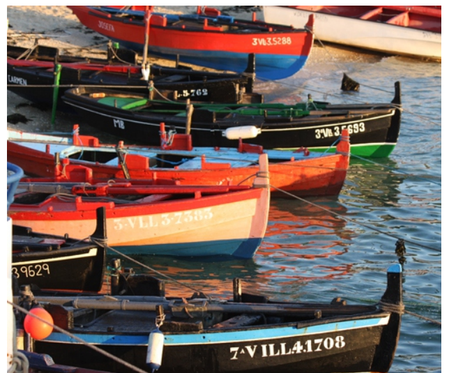
Dornas en Cabodeiro