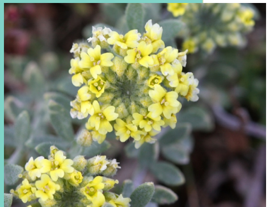
Alyssum loiseleurii , unha planta das dunas gravemente ameazada que se atopa nas dunas do oeste da Illa de Arousa.