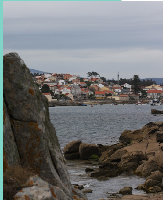
Vista desde a Pedra do Sal