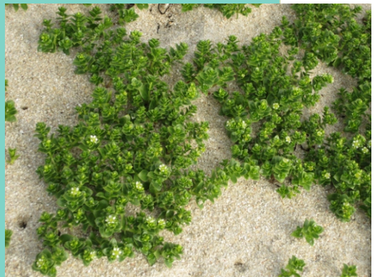
Arenaria do mar ( Honckenya peploides ), unha planta cada vez máis escasa pola presión humana nas praias.