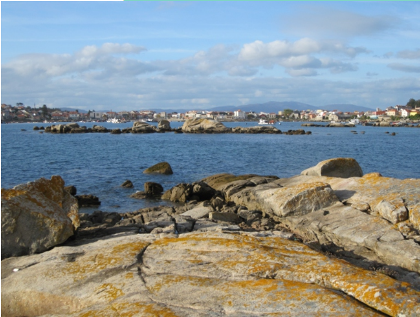
Vista desde a Punta Ouriceira. Ao fondo O Cantiño.