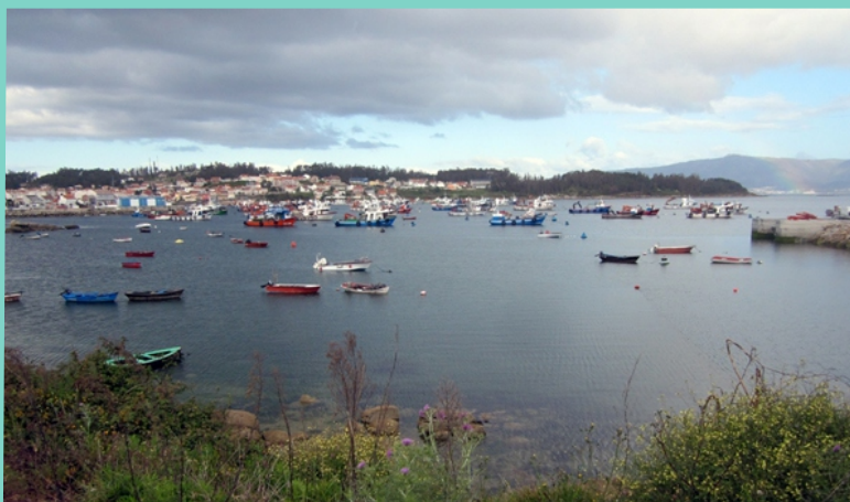
O Xufre, porto principal da Illa de Arousa